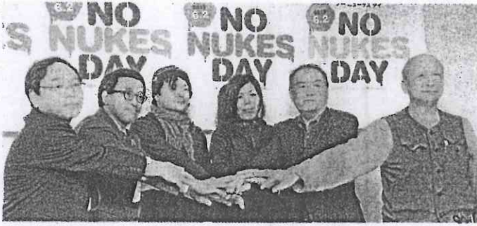
統一ロゴを背に「6・2ノーニュークスデー」の成功へ向けて決意を固める3団体の代表。左から、東京都平代田区